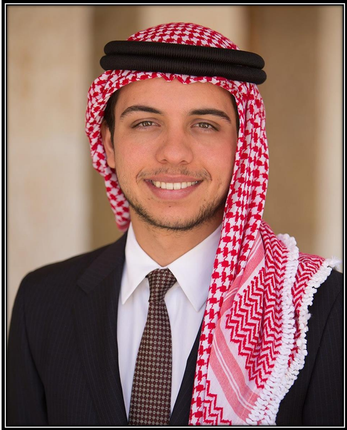
حضرة صاحب السمو الملكي الأمير الحسين بن عبدالله الثاني ولي العهد المعظم