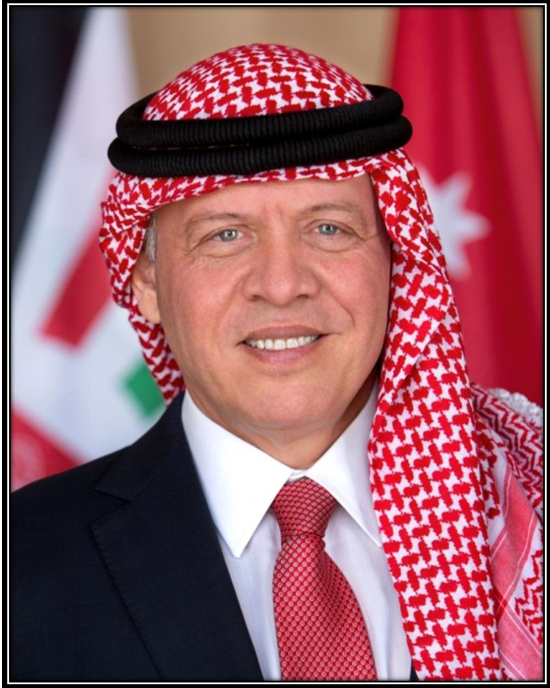
حضرة صاحب الجلالة الهاشمية الملك عبدالله الثاني ابن الحسين المعظم